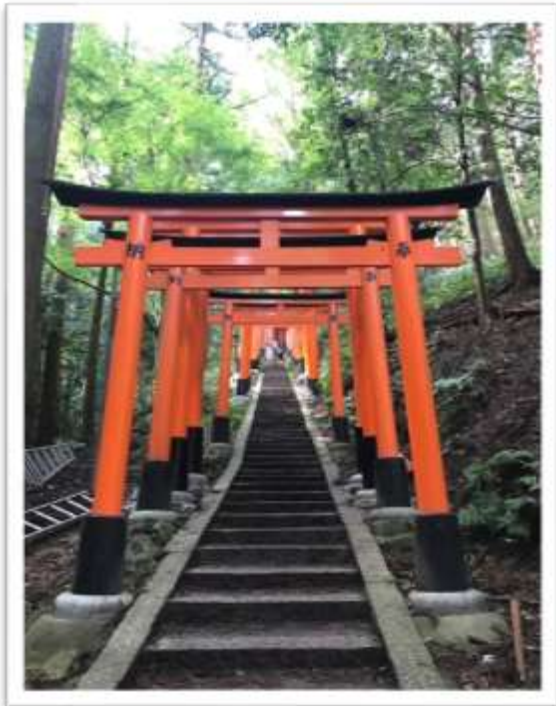
伏見稲荷大社の鳥居

ここは、千年の古刹があり、文士の隠れどころもあり、紫式部の残した物語もあります。