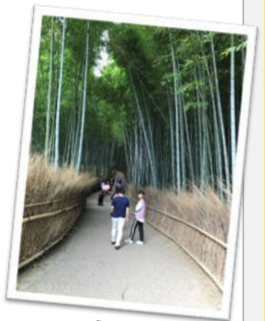
天龍寺からの竹林の道

また、とても好きな所は嵐山です。渡月橋への道は、にぎやかな商店街。天龍寺から竹林の道へ抜け、周辺の寺社めぐりながら嵯峨野を散策します。初めて船に乗った、保津川下りは新緑のアーチ、清涼感ある木々の息吹です。