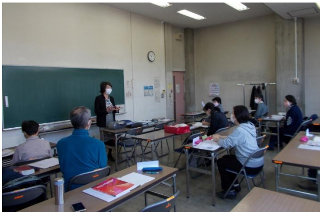
英語 I レッスン風景

言語にはその国の文化が反映されているので、外国語の学習では話せることだけでなく、文化を学び理解することも重要です。最近、韓国ドラマや K-POP の人気で、韓国文化に関心を持つ人たちが増えていて、面白いことに、韓国人である私よりもいち早く韓国のいろいろな新しい情報やニュースをキャッチして、私に教えてくれる生徒さんも一人ではありません。このように韓国について、K-POP やドラマなどを見て感じたことや韓国旅行で経験したことなどを授業時間に共有し、楽しく言語と文化を学んでいます。私は、日本語学習者としての経験と、韓国語教師としての経験を生かしながら、日本の皆さんに韓国語だけでなく韓国・日本、両国の多様な文化を伝えたいと思っています。