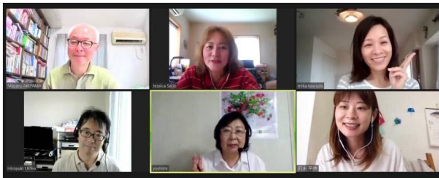
英語 II オンラインレッスン

子育て中のママでも自宅でオンライン講座を受けられたのでとてもよかったです。初心者コースでしたが実際はレベルは様々で皆さん英語が上手でした。以前から来日外国人の接客をしたかったので、これを機にもっと勉強をして希望を叶えたいです。