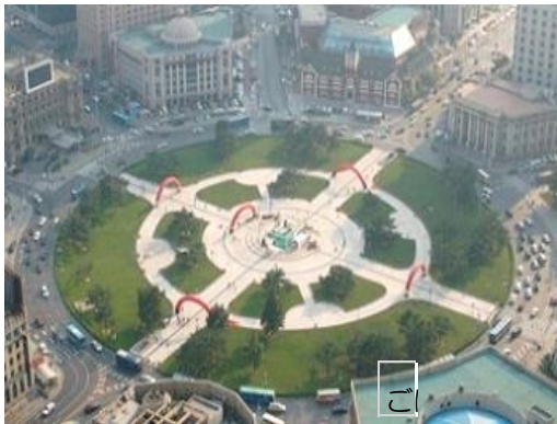
だいにんちゅうざん ひろば 大連中山 広場

大連 だいにん ではエンジュ(花鑑賞会 はなかんしょうかい 、国際ファッション祭 こくさい おんさい )などが開催 かいさい され、海外 かいがい から多くの旅行客 りょこうきゃく が訪 れます。老虎灘海洋公園 らうこたんかいようこうえん や滨海路 はまかいろう などの観光地 かんこうち も あります。