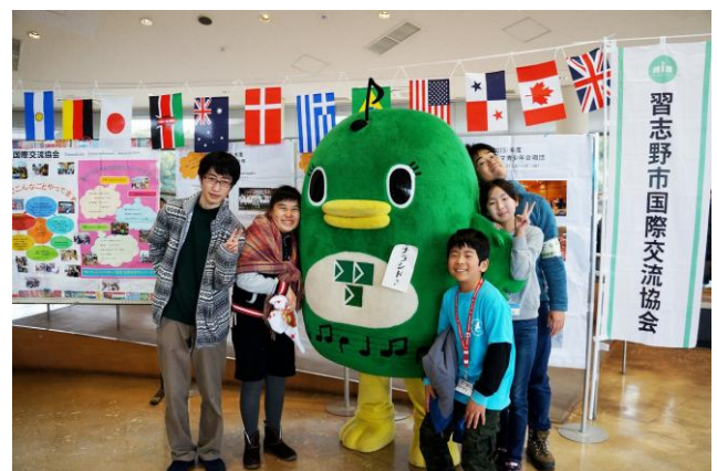
ナラシド♪君も来て、訪れた子どもたちと記念撮影。