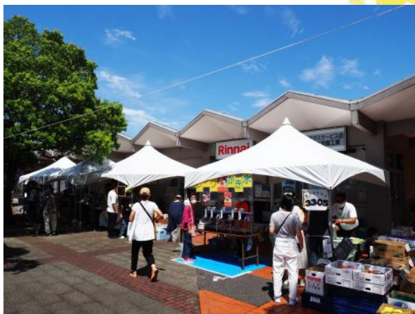
会場には食品や雑貨を販売するテントが並びました