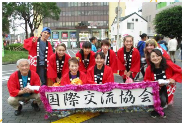
前回2019年のサンバパレード参加のみなさん

習志野市国際交流協会は、会場にブースを設置してPRを行い、サンバパレードに参加します。遊びに来てください。サンバパレードに参加する人は14時にNIA事務局に集合してパレード前にダンス練習をします。軽食も出します。民族衣装での参加、大歓迎です。事前に事務局へ申し込んでください。