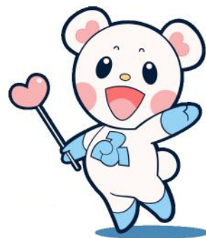
社協のマスコット 「ふくっぴー」

地域の人が住み慣れたまちでその人らしく生活することができるように「誰もが安心して暮らせるまちづくり」の実現を目指して様々な活動を行っています。